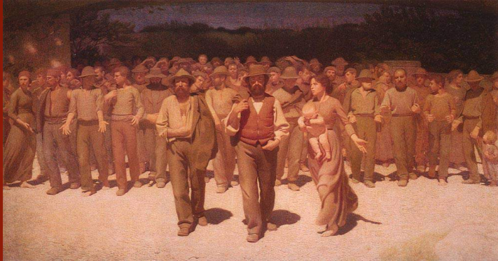
Giuseppe Pellizza da Volpedo, Il quarto stato (le quart Etat) 1896-1901

Dans la société moderne, le statut social est défini par des catégories économiques et sociales: par la place de chacun dans le processus de production des richesses